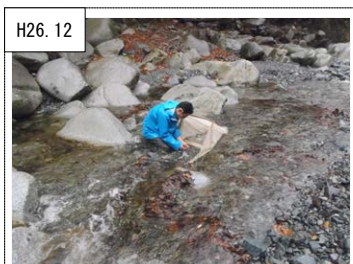
H26.12 ⑪水環境モニタリング 河川のモニタリング調査。酒匂川流域で底生動物の調査を行った。(玄倉川 ユーシンロッジ前)