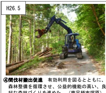
H26.5 ④間伐材搬出促進 有効利用を図るとともに、森林整備を循環させ、公益的機能の高い、良好な森林づくりを進めた。(南足柄市塚原)