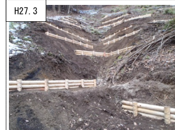
H27.3 ③溪畔林整備 土壌流出が発生している、あるいは発生しそうな箇所にて土壌保全工を実施した。(山北町仲の沢)