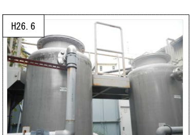
H26.6 ⑦地下水保全対策 有機塩素系化学物質により汚染された地下水を施設の装置に通すことにより水質浄化を図った。(秦野市)