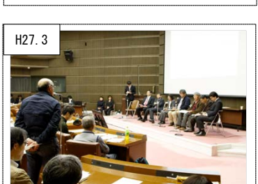
H27.3 ⑫県民参加の仕組み 県民フォーラムでは、講師・パネリストと参加者との間で意見交換が行われた。(横浜市)