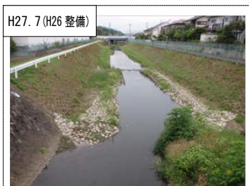
H27.7 (H26整備) ⑥河川・水路における自然浄化対策 川の流れに変化をつけ、水生生物が生息できる環境を創出した。(厚木市恩曾川)