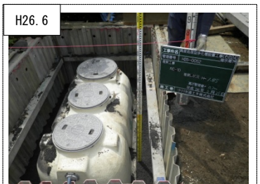
H26.6 ⑧⑨ダム集水域の生活排水対策(下水道・浄化槽) 合併処理浄化槽(5人槽)の整備により、水質改善を図った。(相模原市緑区)