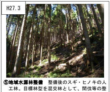
H27.3 ⑤地域水源林整備 整備後のスギ・ヒノキの人工林。目標林型を混交林として、間伐等の整備を行った。(湯河原町鍛冶屋)