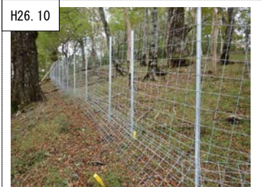
H26.10 ②丹沢大山の保全・再生 シカによる採食を 방지、植生を回復させ、土壌を保全するため、植生保護柵を設置した。(山北町中川)