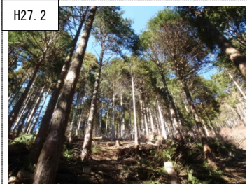
H27.2 ①水源の森林づくり 水源かん養など公益的機能の高い森林を目指し、間伐等の整備を行い明るくなった森林。(秦野市堀山下)