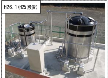
H26.1 (H25設置) ⑩相模川水系上流域対策 山梨県内の下水処理場に新たに設置したリンを取り除くための設備を移動した。(山梨県桂川清流センター)

○県民会議による点検・評価 水源環境保全税を財源に行う施策に県民意見を反映させるため「水源環境保全・再生かながわ県民会議」が置かれています。県民会議では毎年「かながわ水源環境保全・再生実行5か年計画」で位置付けている特別対策事業(12事業)の実施状況を点検・評価しています。また、結果を県民に情報提供するため「点検結果報告書」を作成しています。