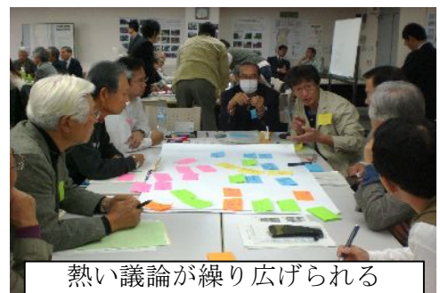
熱い議論が繰り広げられる