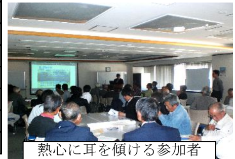
熱心に耳を傾ける参加者