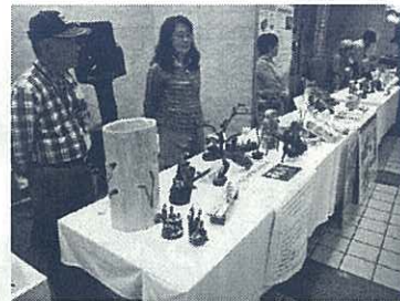
間伐材製品の展示