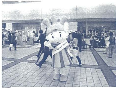
しずくちゃんの登場