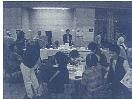
来場者へアンケート・水のプレゼント