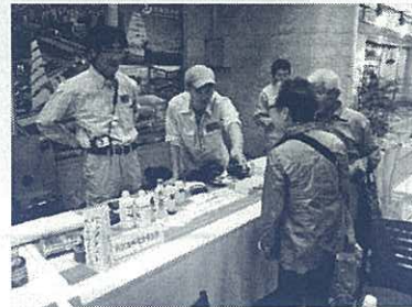
水質調査パックテスト