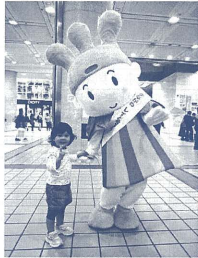
子ども達と写真撮影