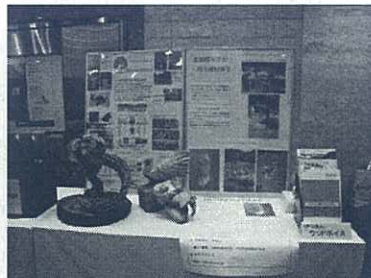
団体活動紹介ポスターの展示