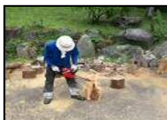
間伐材を活用した製品の製作

※特別対策事業とは、「かながわ水源環境保全・再生実行5か年計画」に定める事業です。詳しくはホームページをご覧ください。