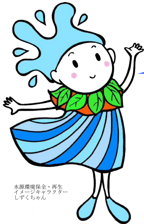
水源環境保全・再生 イメージキャラクター しずくちゃん