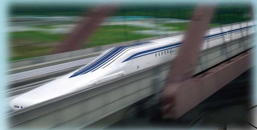
Linear Chuo Shinkansen