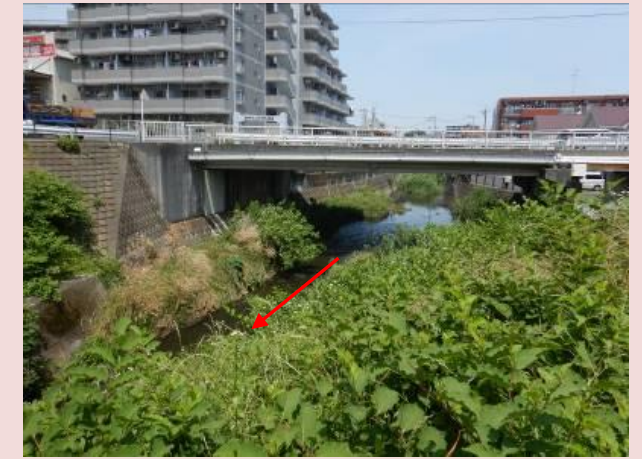
改修前の状況(新道下大橋下流)