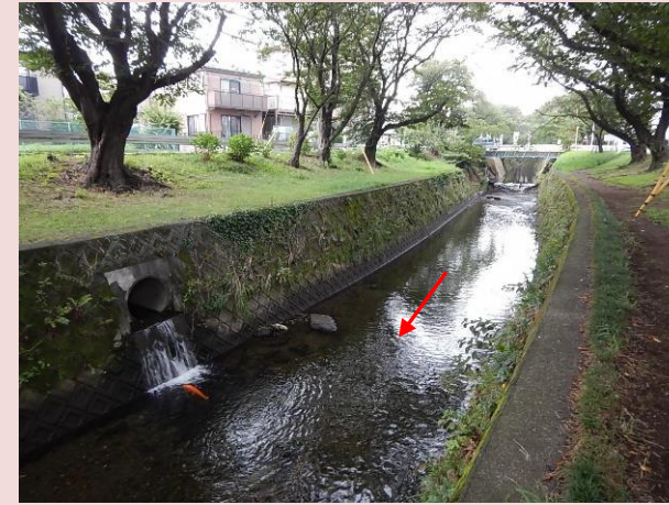
改修前の状況(福田6号橋下流)

現在は、千本桜が並ぶ「福田 8 号橋」から「新道下大橋」までの区間の護岸整備を進めています。