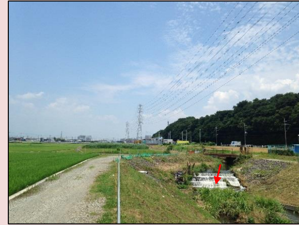
改修前の状況(80号橋付近)