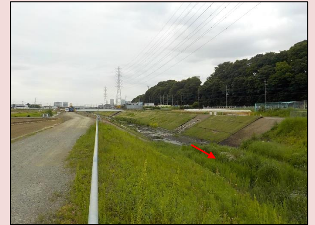
改修後の状況(80号橋付近)