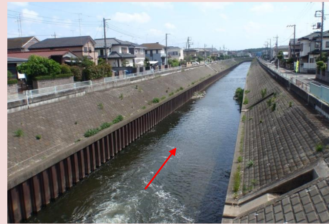
改修前の状況（鹿島橋付近）