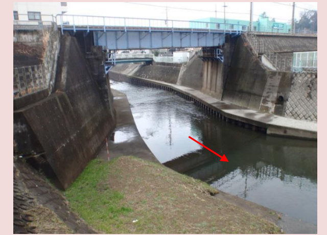
相模鉄道交差部付近