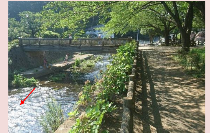
親水施設（ふれあい橋付近）