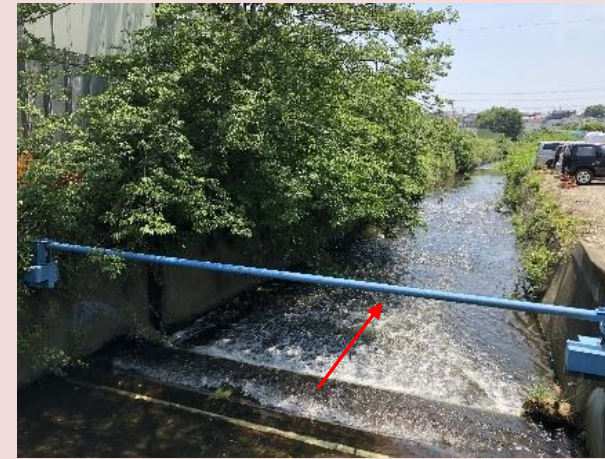
改修前の状況（打越橋下流）