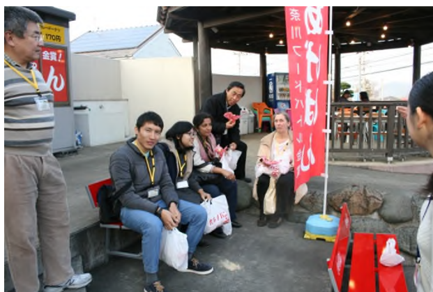
(神奈川フードバトルで金賞をとったあげパンに皆さんも大満足～♪)

ちなみに、このとき工場内では何が起きていたのか！？こちらも かなファン の Facebook で 12月16日に投稿された動画をご覧ください！