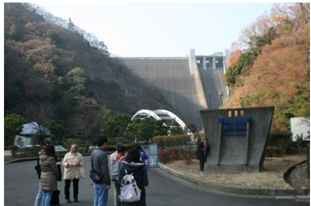
(これだけ歩いてもまだまだ大きいダム！)