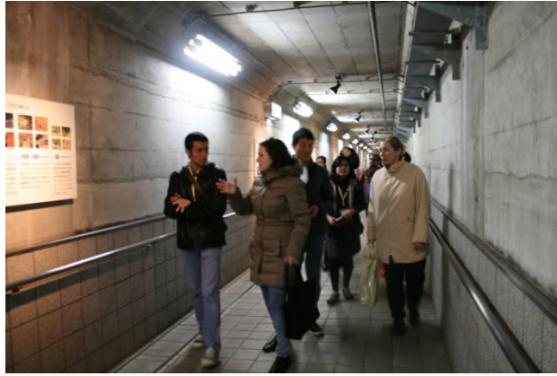
(ひんやりとしたコンクリートを抜けるとダム下に到着です)

ダム下から 県立あいかわ公園 へは歩いて行くことができます。景色を楽しみながらのんびり歩いて行くのもおすすめですよ～♪