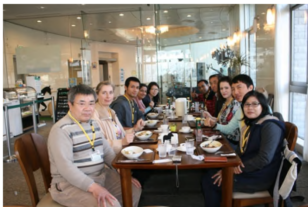
(明るく開放的な店内です)