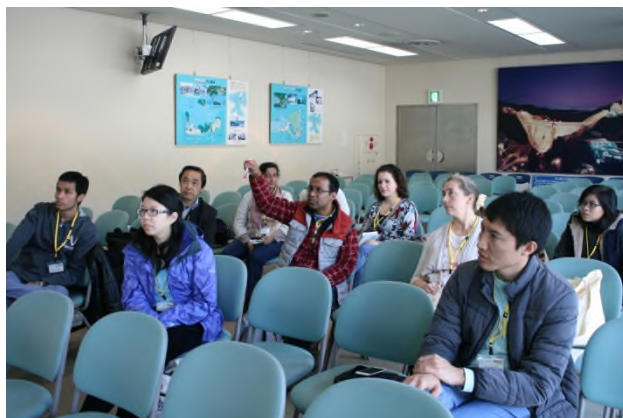
(参加者の皆さんも積極的に質問！)

レクチャーの後は、水とエネルギー館内にある「LAKE SIDE CAFE」でお昼ご飯♪この名物はなんとと言っても「 宮ヶ瀬ダムカレー 」!!!なんと「放流」が楽しめちゃうんです！