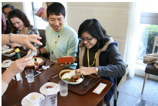
(ダムカレー“放流”中！)

(詳しくは、 かなファンのFacebook で12月16日に投稿された動画をご覧ください！)