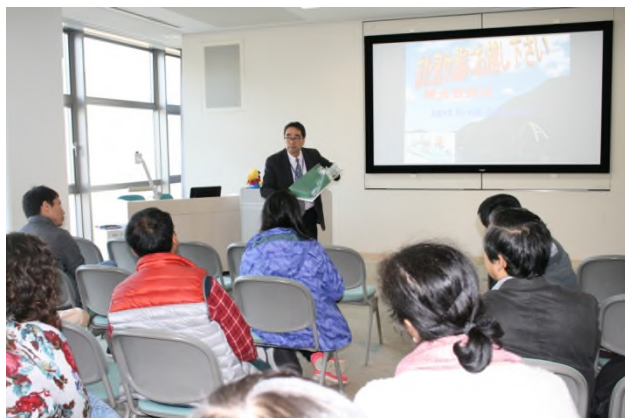
(ダムについてお勉強中！)

当日は、12月とは思えないほど暖かく、晴れていました。まず向かったのは 宮ヶ瀬ダム 。隣接する「水とエネルギー館」で宮ヶ瀬ダムについてのレクチャーを受けました。水とエネルギー館の副館長さんが、私達のためだけに宮ヶ瀬ダムの仕組み、役割、建設の歴史などを分かりやすく解説してくださいました！