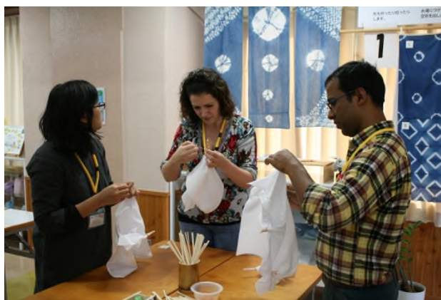
(まずは割箸と輪ゴムで模様を作ります)