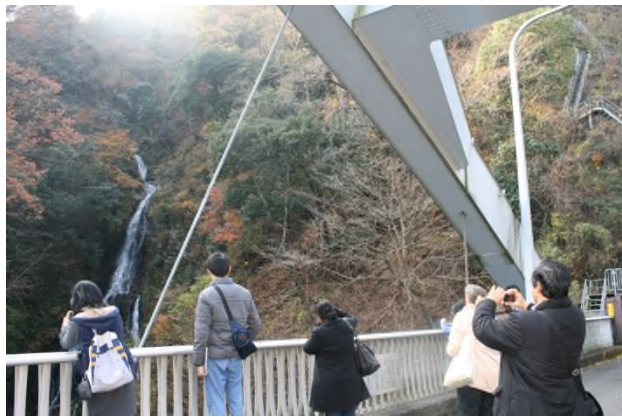
(滝発見！紅葉もまだ少し残っていました～)

ダム下から 県立あいかわ公園 へは歩いて行くことができます。景色を楽しみながらのんびり歩いて行くのもおすすめですよ～♪