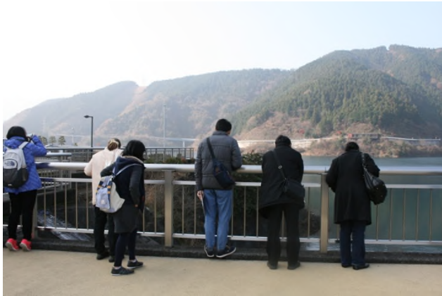
(こちらは貯水池サイド。山並みが美しいです)

いよいよダム本体の見学に出発！宮ヶ瀬ダムは 首都圏最大級 の規模を誇り、私たち県民の生活を支える大切な水源なのです。