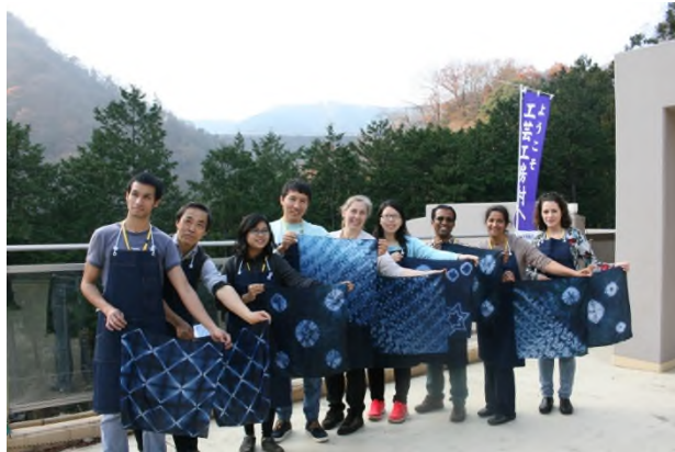
(渾身の作品を手で一列に並んで記念写真)