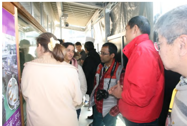
(社長と部長への質問も絶えません！)

ちなみに、このとき工場内では何が起きていたのか！？こちらも かなファン の Facebook で 12月16日に投稿された動画をご覧ください！