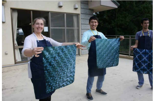
(自然の風にあてます)

藍染の面白いところは、風にあてると色が 黄色 → 緑色 → 青色 と変化するところです。特に外国人参加者のみなさんはこの色の変化に驚きつつも、きれい！と感動していました。