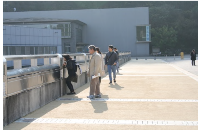
(反対側約 40km 先にみなとみらいが望めます)