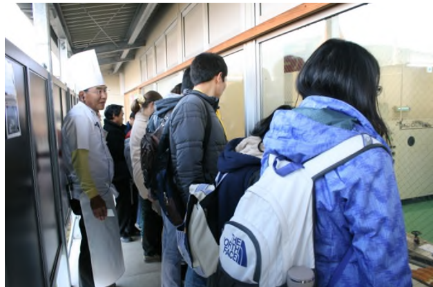
(生産ラインに沿って設けられた見学コース)

社長、そして荻野社長の息子さんである部長が直々に工場の解説、そして見学ルートを案内してくれました。