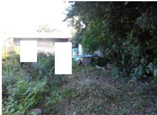
敷地内北西側から撮影