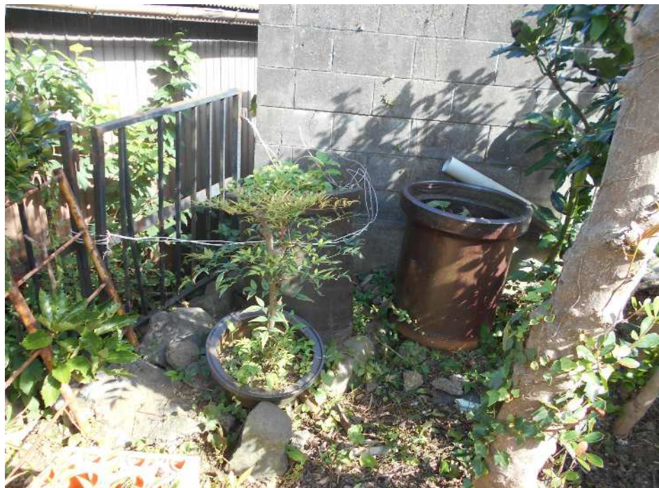
敷地内東側から撮影