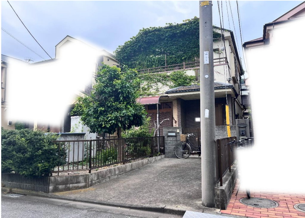
前面道路南東から