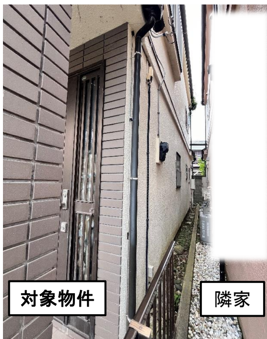
東側隣地境界付近