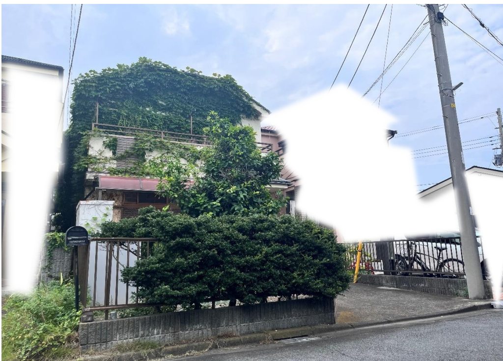
前面道路南西から