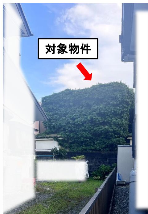
北側から対象物件を臨む