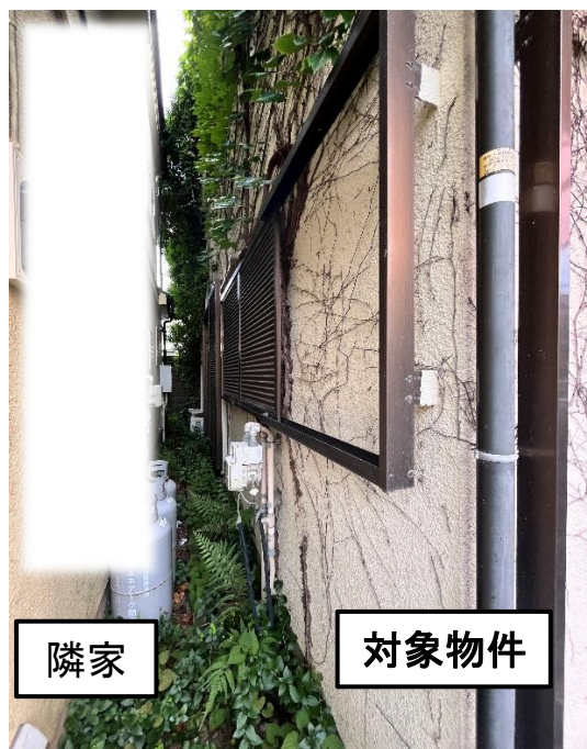
西側隣地境界付近