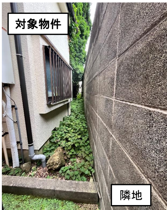
北側隣地付近の様子