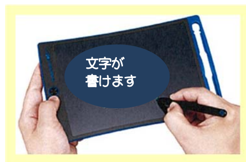
筆記用電子表示板

病院では、受付で聞こえない方がいらしたら、看護師などが筆談や簡単な手話で対応しています。また、歯科診療所では、治療いすに筆談がしやすいように、筆記用電子表示板を取り付けています。