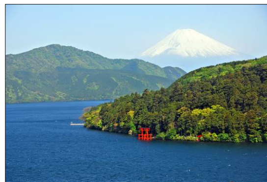
富士山が見える 箱根町 で宿泊