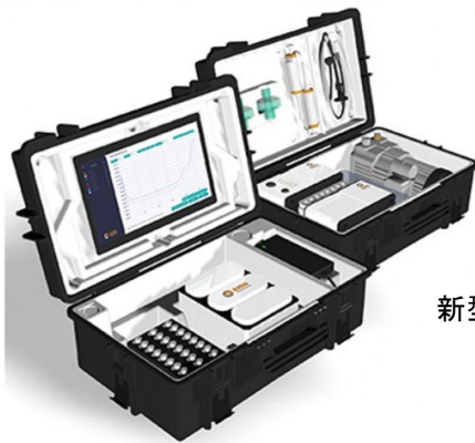
新型コロナウイルスの迅速検出法