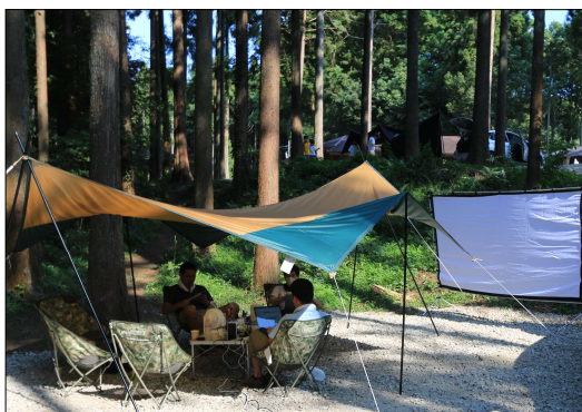
森の空気を浴びながら 小田原市 で仕事