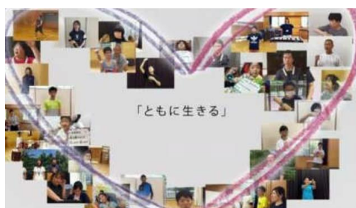
(2) 「ともに生きる社会かながわ推進週間」における集中的広報