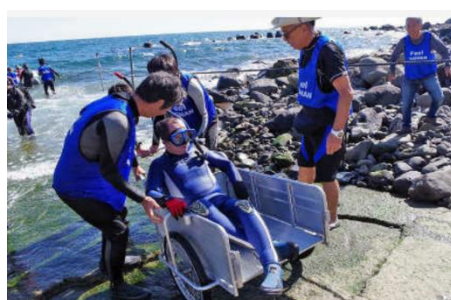
(3) 企業等の仲間づくり