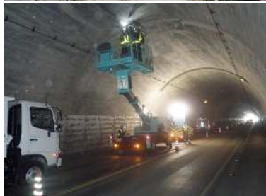
写真上: 整備を進めている県道42号藤沢橋間厚木(厚木市) 写真左下: 県道514号宮ヶ瀬奥川 施設の長寿命化を図るための宮ヶ瀬トンネルの点検 写真右下: 国道134号鎌倉高校前交差点の改良工事 (右折レーン設置+歩道拡幅整備)