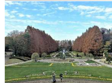
写真左: 県立相模原公園の噴水広場の整備 写真右: 県立あいかわ公園の遊具整備

神奈川県が所管する都市公園は県内に27箇所(総面積約730ha)あり、海や川、都市林や森など多様な自然環境や、歴史的な遺構や文化を背景に、県民の憩いや、レクリエーションの場として、年間約1,300万人の方々にご利用いただいています。