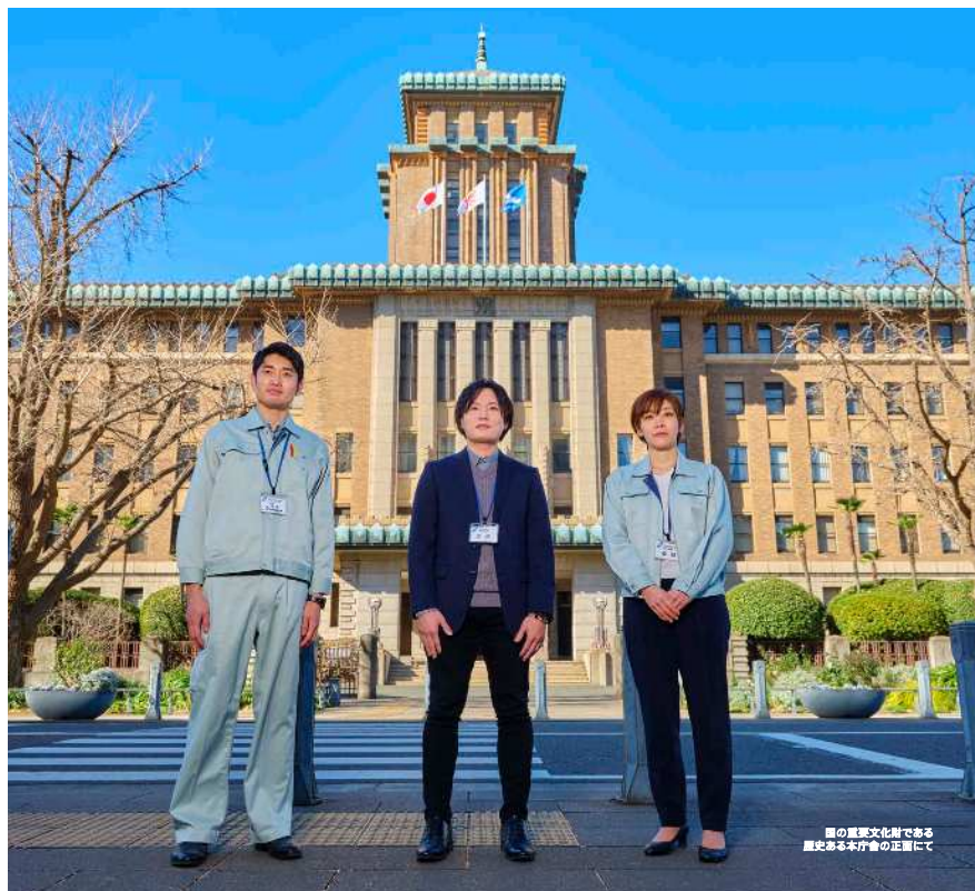
国の歴史文化財である 歴史ある本庁舎の正面にて