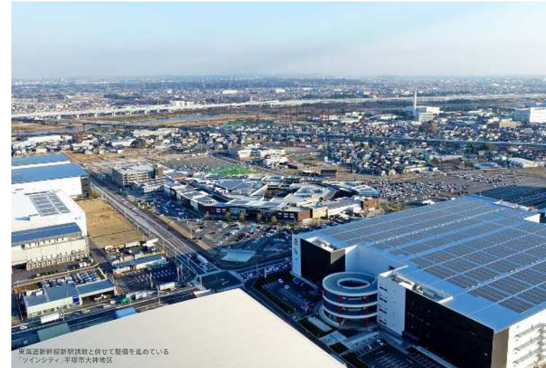
東海道新幹線新駅誘致と併せて整備を進めている「ソインシティ」平塚市大神地区

相模川が中央を流れる県央・湘南地域では、東海道新幹線新駅誘致地区を中心に相模川兩岸で環境と共生する都市づくりを推進しています。