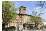
写真上：県庁本庁舎のある横浜都心臨海部 写真中：県内の豊かな自然環境／丹沢湖と丹沢の山並み 写真下：歴史的な観光資源／大磯町・旧吉田茂邸

「土木のゼネラリスト」として、県民の安全・安心のために、多様な現場で幅広い業務に携わることで多くの学びを得ることができ、自分自身も成長できることが、神奈川県土木職の魅力です。