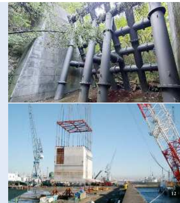
写真上：現在所管している砂防堤 写真下：防波堤のケーソン据付工事

この数年で働き方も大きく変わりました。自分のスケジュールに合わせて計画的にフレックスタイムをしたり、男性も育児休暇を取得し、未来の日本を支える子育てに参加しています。私自身の子育て経験や反省点を踏まえ、周りの職員が関与することなく子育てできる環境づくりを常に心がけていますし、県庁全体の機運が醸成できてきていると実感しています。