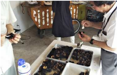
“キャベツウニ”の試食会

横浜三塔の一つである県庁本庁舎（昭和3年竣工）。他に2棟。さらに新しい庁舎も建設中です。赤レンガ、山下公園、横浜大さん橋、マリンタワー、横浜中華街、横浜スタジアムなどが徒歩圏内。繁華街も近くアフター5も充実！