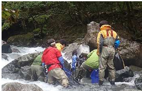
丹沢の溪流での調査風景

広い敷地で自然環境抜群！試験場内にも絶滅危惧種のピオトープがあり、生き物や自然を身近に感じることができます！近くには相模川が流れ、キャンプ場や公園があり、桜の名所にもなっています。