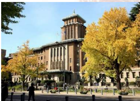
県庁本庁舎 キングの塔