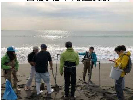
現場での調査に関する指導

浜に行って漁業者から話を聞くと、思いもしなかった情報や見えなかった課題に気付くことができます。現場の交流から神奈川の水産を元気にしていきたい方、ぜひ一緒に働きましょう！