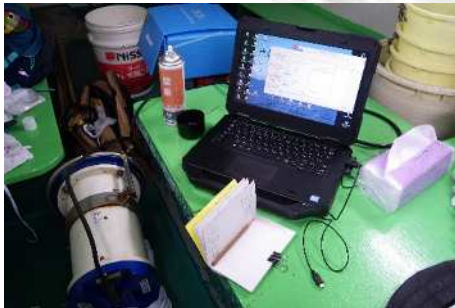
船上で流向流速計のデータ処理中...