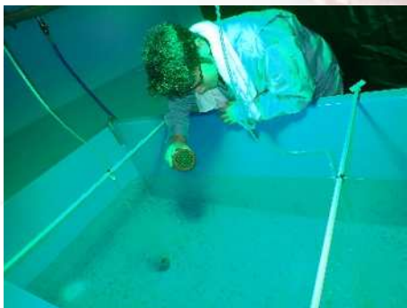
緑色LED光照射による マコガレイ稚魚成長促進試験

私は、入庁当初から主に東京湾の貧酸素水塊に関する調査研究を担当していて、夏を中心に船を使った観測やごく沿岸域での連続観測を行っています。暑さと船の揺れに耐えながらの調査は大変な時もありますが、陸からは見られない横浜港や観音崎のちょっぴり特別な景色に元気づけられています。そして、目の前の仕事に追われるとつい見失いがちなのですが、私たちのやっている仕事の向こう側には常に漁業者さんをはじめとする神奈川県民の皆さんがいます。「県民の皆さんが今どんなことを求めているのか」ということに、ピンとアンテナを張って行動できる職員になるため、これからも精進したいと思います。