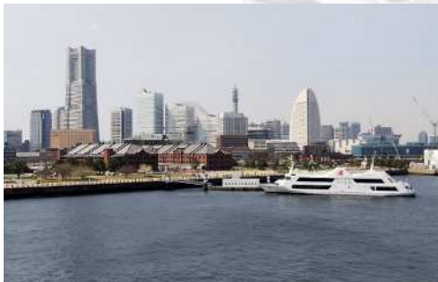
大さん橋からの眺め