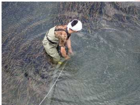
アマモ場へのトラフグの放流