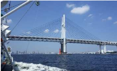
ベイブリッジを越えて、いざ次の観測点へ

三浦半島の先端、北原白秋の歌でも有名な城ヶ島に所在。島ですが橋で本土とつながっており、島外から通勤する職員がほとんどです。自然に恵まれた環境で研究に打ち込むには最適！