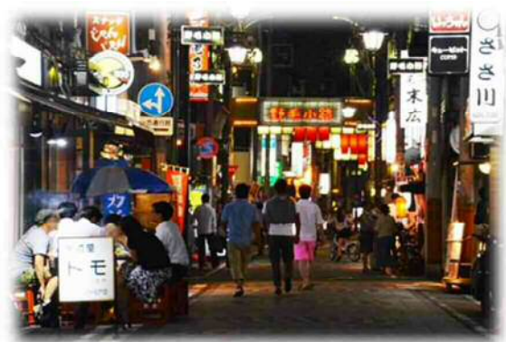
野毛地区の飲食店街

県内の各地域で楽しめる夜の観光資源を紹介するガイドマップやウェブページを作成し、消費活動を喚起するナイトタイムエコノミーを充実させる。