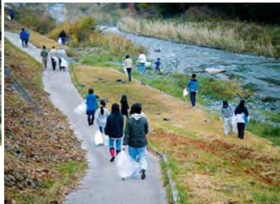
松田会場における清掃活動

しむ方々が大勢いらっしゃいます。また、近年、自然への関心が高まる一方で、残念ながら、マナーの悪さやゴミの問題も少なからず指摘されています。