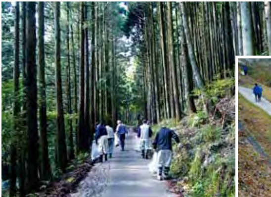
清川村会場における清掃活動