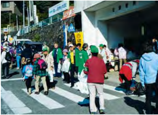
伊勢原会場における普及啓発活動

平成二十三年十月十六日(日)清川村会場でのイベントを皮切りに、今年も「丹沢大山グリーンキャンペーン」がスタートします。今年は、十一月三日(木)の厚木市の中央会場を中心に、県内7市町村に会場を設置し、キャンペーンを実施します。