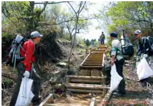
登山道における調査状況

た。丹沢ほどの登山者の多い山塊でゴミが減りつつある、ということとは地道な「拾う」活動の成果と、「捨けない」意識の定着の結果だろうと思います。空き缶などは古いものがほとんどです。