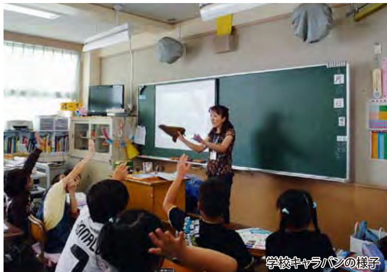
学校キャラバンの様子

十月二十九日(土) 江ノ島にあるかながわ女性センターにおいて、フォーラムを開催し、ごみの発生抑制について効果的な方策を検討していくと同時に、海岸利用者や国、企業からの支援や協力など、清掃の仕組みの充実について考えます。また広く参加者を募り、行政・市民・企業・団体や、県内の海岸線の横のつながりと、河川上流域との縦のつながりなど、さまざまなネットワークを強化、拡充していきます。