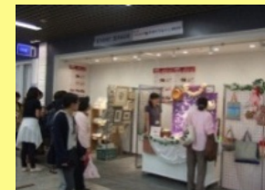
川崎地下街(アゼリア)で実際に販売体験 女性起業家手作りマルシェ