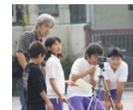
子どもたちへの映像教育