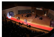
毎日映画コンクール表彰式