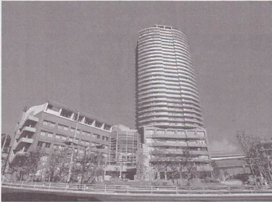
〔会場となる横須賀市生涯学習センター〕

第四十六回関東甲信越静公民館研究大会が、今月二十五日（木）、二十六日（金）の二日間に行われ、横須賀市で開催されます。