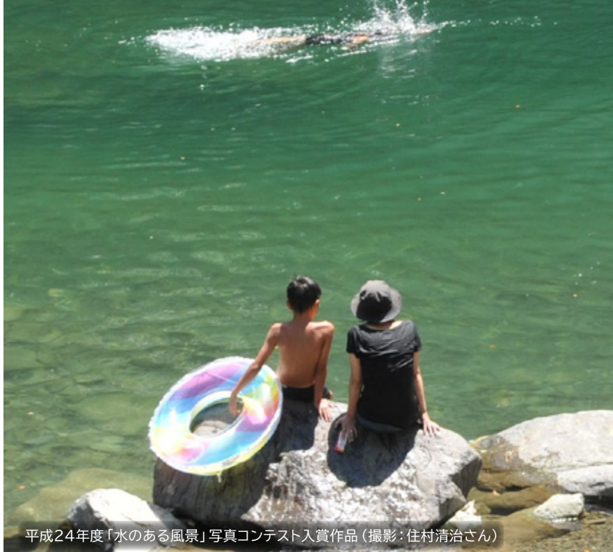
平成24年度「水のある風景」写真コンテスト入賞作品

クロスワードを全部解いてください。 次にAからEの文字を順に並べてできる言葉を答えてご応募ください。