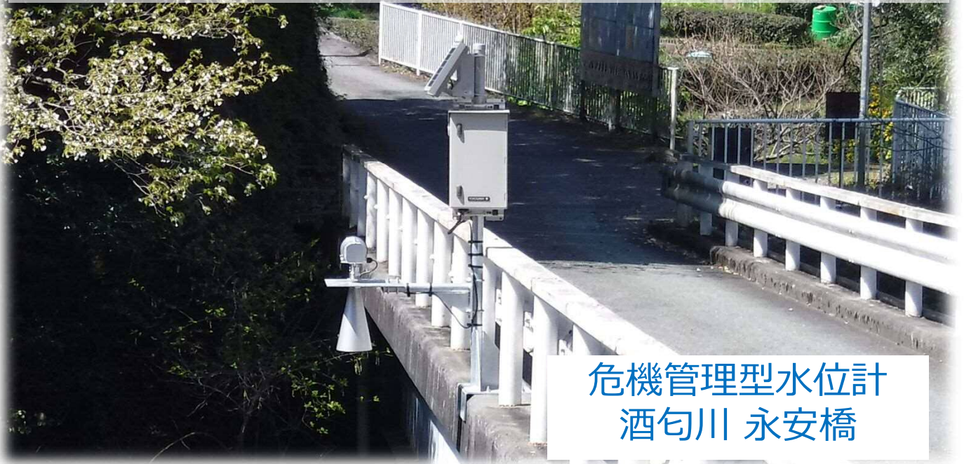
危機管理型水位計 酒匂川 永安橋