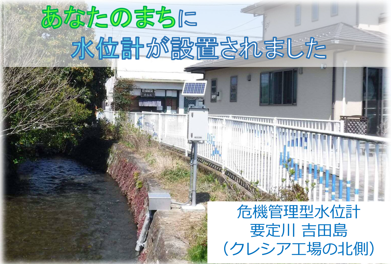
危機管理型水位計 要定川 吉田島 (クレシア工場の北側)