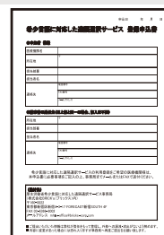
電話通訳サービスの 申込書

※2022年3月までにご登録済の医療機関はご利用にあたっての再申し込みは不要です。 ※登録前の緊急時利用の場合は、下記問い合わせ先（運営事務局）までご相談ください。