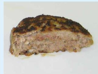
ハンバーグ(火が通っている)