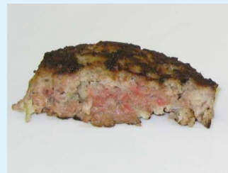
ハンバーグ(火が通っていない)