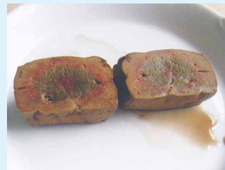
レバー(火が通っていない)