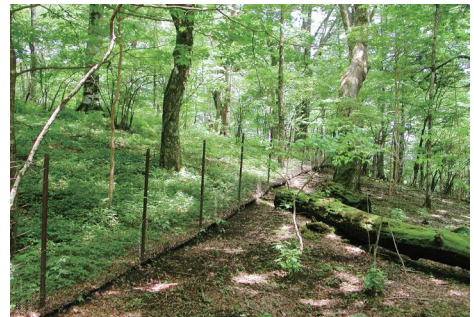
土壌保全対策による植生回復状況

丹沢大山では、植生保護柵の設置などの土壌保全対策やニホンジカの管理捕獲、これまでの技術開発の成果などを活用したブナ林の保全・再生対策、県民との連携・協働による登山道整備などを進めることで、自然の再生を図ります。