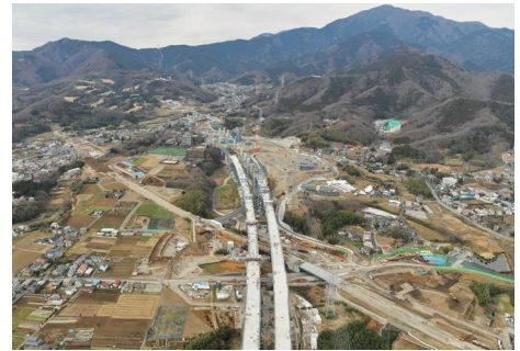
新東名高速道路 伊勢原大山インターチェンジ

新東名高速道路や横浜湘南道路及び厚木秦野道路(国道246号バイパス)などの整備促進や(都)湘南新道の整備などの道路網の整備を進めるとともに、スマートインターチェンジの整備促進など道路網の有効活用にも取り組みます。また、JR東海道本線の村岡新駅(仮称)の実現に向けて取り組みます。