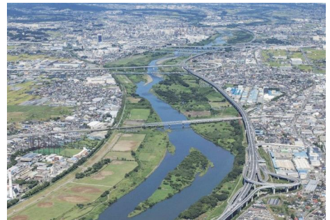
ツインシティ整備地区周辺の状況

再生可能エネルギーの導入など、環境共生モデル都市ツインシティを整備することで、魅力あるまちづくりを推進するとともに、全国や首都圏との交流連携の窓口となる東海道新幹線新駅を設置し、地域全体の活性化を図ります。