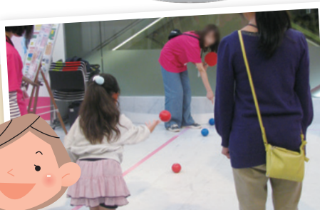
ポッチャをやってみよう!