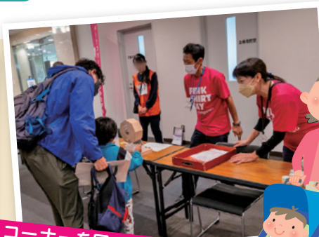
コーナーを回って景品ゲット!