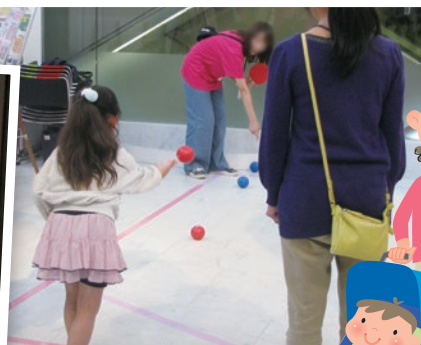
ボッチャを やってみよう!