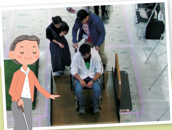
車いすに乗ってみよう