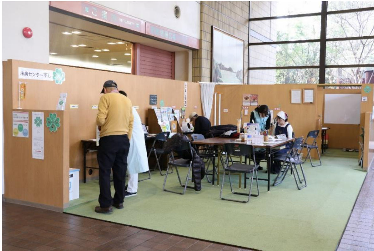
未病センターずし市役所