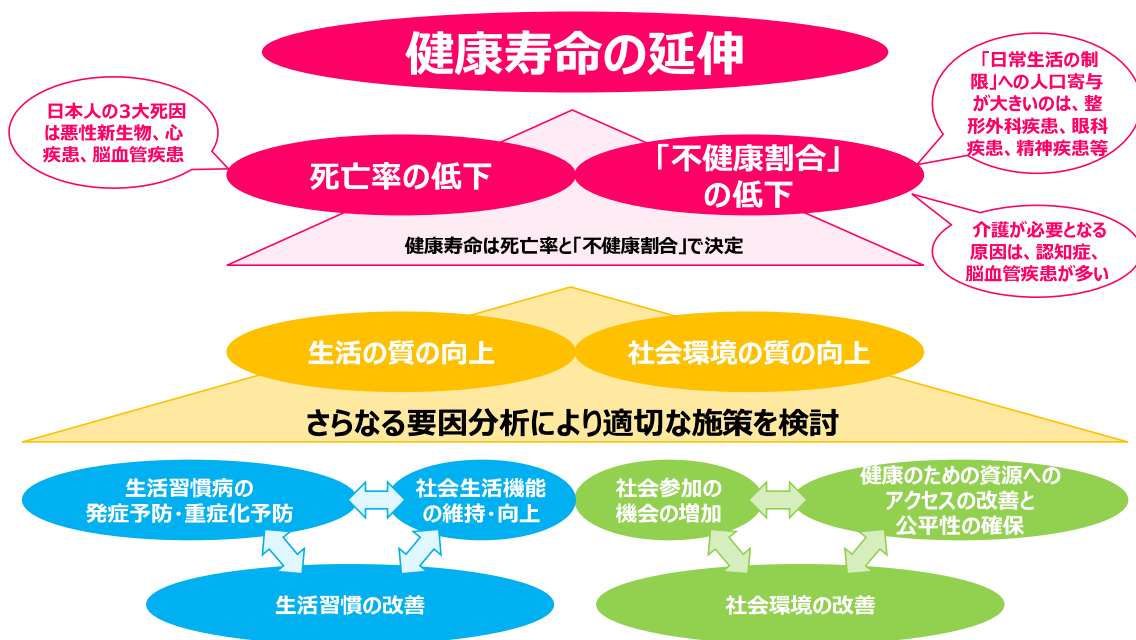
図表 21 健康寿命の延伸に向けたフロー

前にも触れた通り、健康寿命の規定要因についての分析は未だ十分とは言えない。現時点では、「何をすれば何年健康寿命が延伸するのか」という問いに対して明確に答えることはできないが、今後一層の要因分析を進め、死亡率と「不健康割合」の低下につながる効果的な施策を検討・実行していくことで、健康寿命の延伸目標を達成していくことが望まれる。