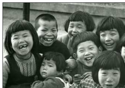
(左) 土門拳「おしくらまんじゅう」(右) 土門拳「笑う子」