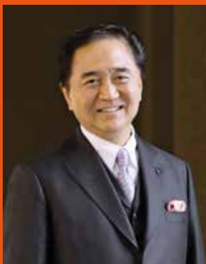
Yuji Kuroiwa Gobernador de la Prefectura de Kanagawa

* Inochi es una palabra japonesa que significa “vida”.