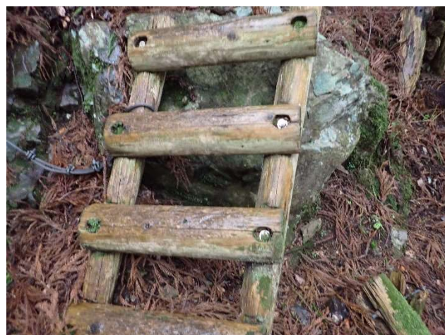
とくに丸太部分は横滑りし易くなっています