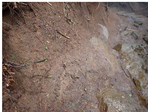
岩の部分、土の部分ともに滑りやすい斜面