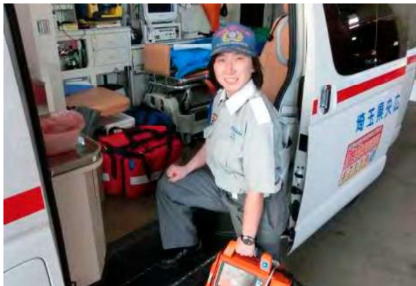
きゅうきゅうめい きゅう急きゅう命し