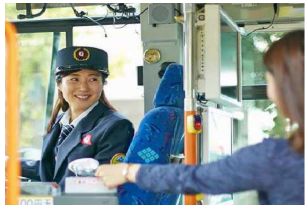
うんてん バス運転し