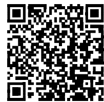
携帯電話サイト 「かながわモード」

右の携帯電話サイト「かながわモード」は、神奈川県教育委員会が作成した携帯電話用のサイトである。このページには、携帯電話を安全に、安心して利用するための「してはいけないこと」「やらなければいけないこと」「気をつけること」がまとめてある。保護者、小学生、中学生、高校生、教職員を対象に、代表的なトラブルの事例とその対処法を解説するほか、架空請求サイトなどに接続してしまうケースを疑似体験するページも用意されている。