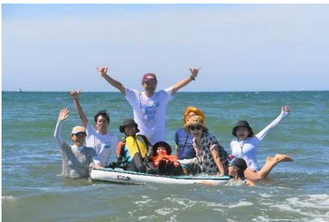
かながわバリアフリービーチ (海水浴の体験)