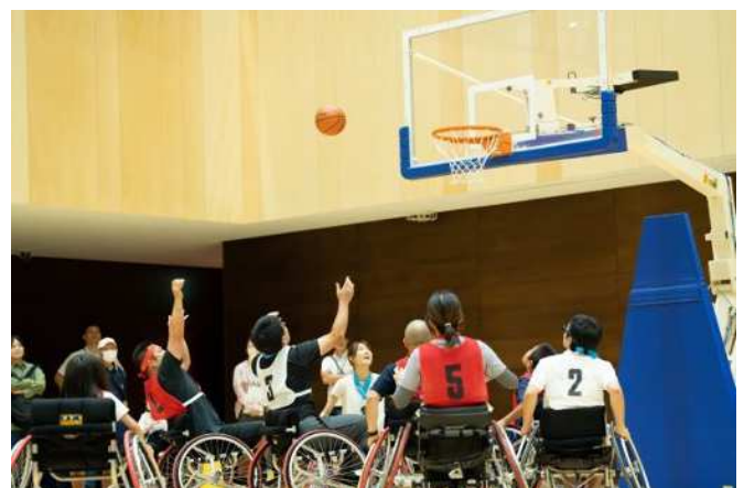
かながわパラスポーツフェスタ (車いすバスケットボール)