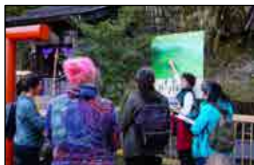
大山地域 地域通訳案内士 (イメージ)