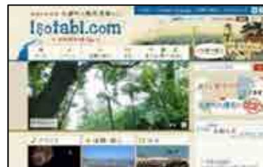
大磯地域 現行の観光ウェブサイト