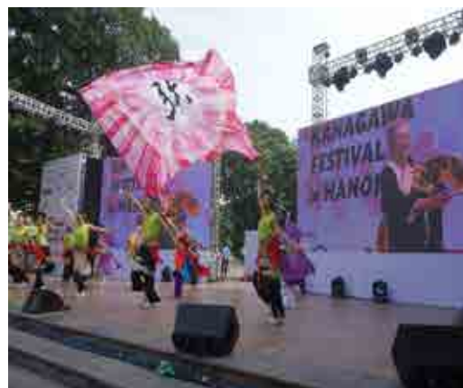
⑩KANAGAWA FESTIVAL in HANOI