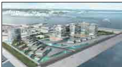
城ヶ島・三崎地域 整備後の二町谷地区 (全体イメージ)