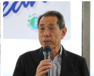
■ ご挨拶 桐ヶ谷覚氏(逗子市長)