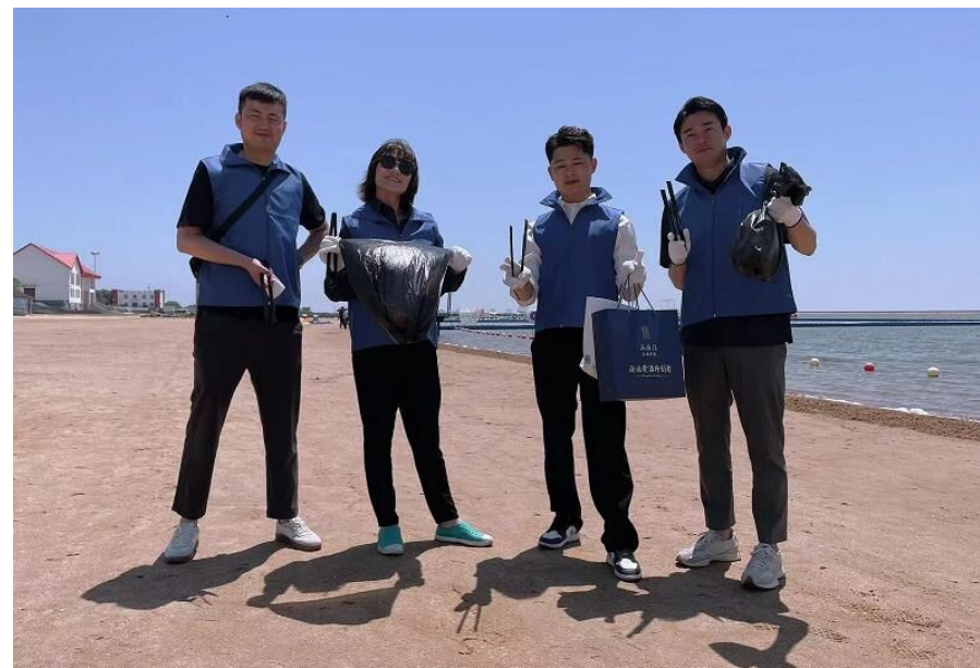
中国 上海 Shanghai Blue Sands