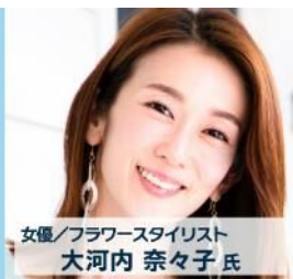
女優/フラワースタ일리スト 大河内 奈々子氏