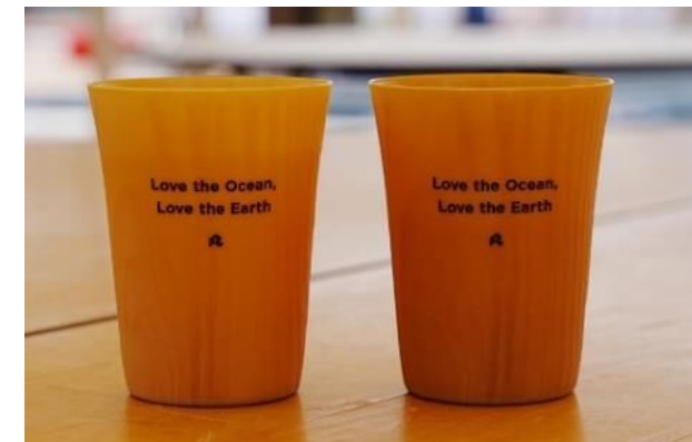
表彰式でも、間伐材を使用した『森のタンブラー』を使用