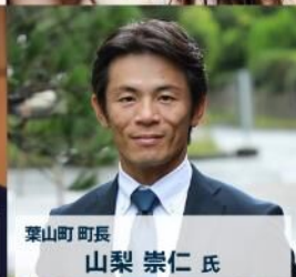
葉山町 町長 山梨 崇仁氏