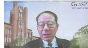
■ 基調講演 鈴木寛氏 (東京大学公共政策大学院 教授)