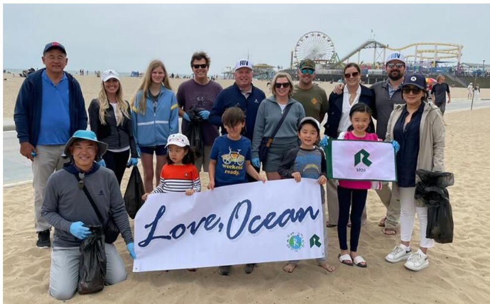
アメリカ ロサンゼルス サンタモニカビーチ