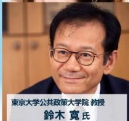
東京大学公共政策大学院 教授 鈴木 寛氏