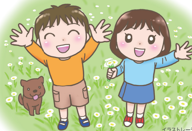
イラストレーション：野波ツナ

2次元バーコードが読み取りにくい時は▶▶▶ 読み取りたいコードの上下のコードを指などで隠していただくと、必要なコードが読み取れます。