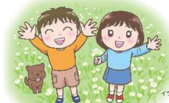
イラストレーション：野波ツナ

2次元バーコードが読み取りにくい時は▶▶▶ 読み取りたいコードの上下のコードを指などで隠していただくと、必要なコードが読み取れます。