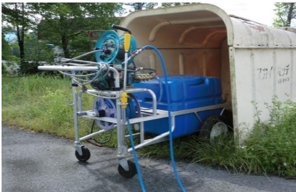
車両消毒設備（動力噴霧器）