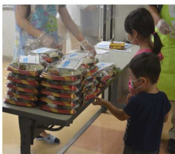
厨房と配膳台の間は、透明ビニールでシールド