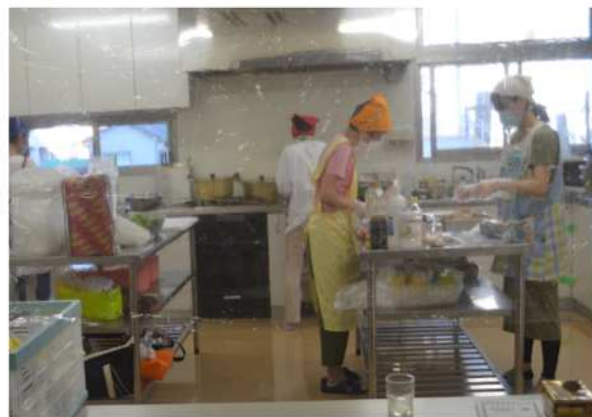
厨房は人数制限（5人）