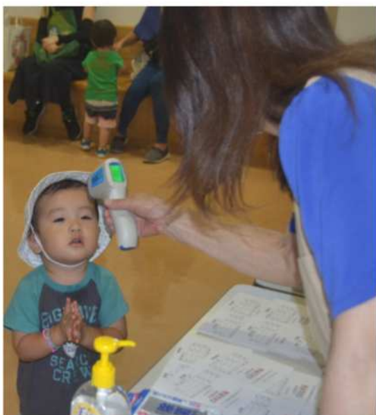
入口では、検温とアルコールによる手指消毒