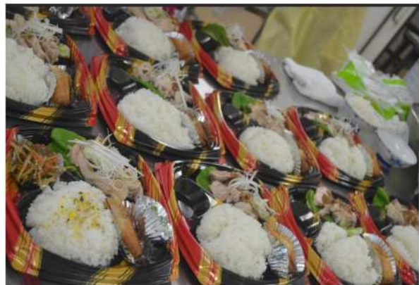
栄養満点のお弁当