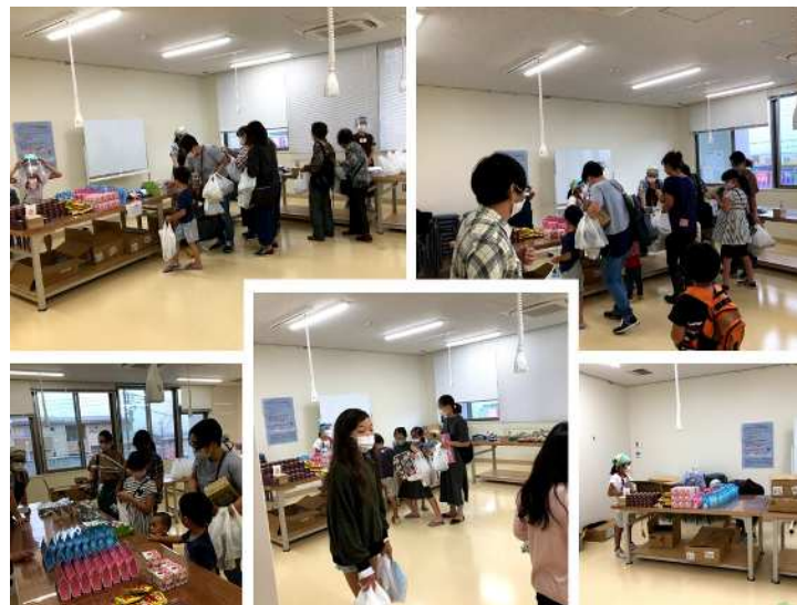
お弁当 (おとな・こども・デザート)