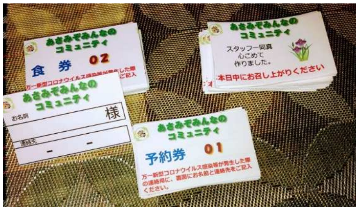
食券やお弁当に貼付したカード