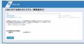
LINEコロナお知らせシステム 登録フォーム