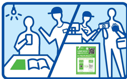
QRコード読取用紙は POPとして店内の目に触れる所に 配置してください