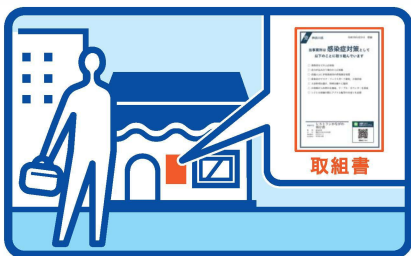
取組書は店先に掲示する