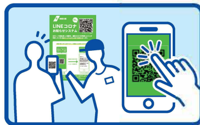
来店者にQRコードを 読み取って貰ってください