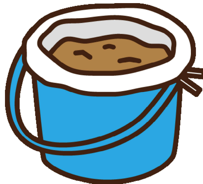
かたづけ F13 バケツ2 つちいり