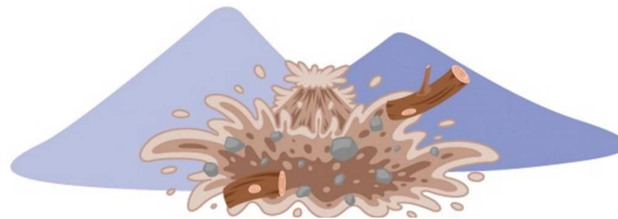
さいがい A6 やまくずれ