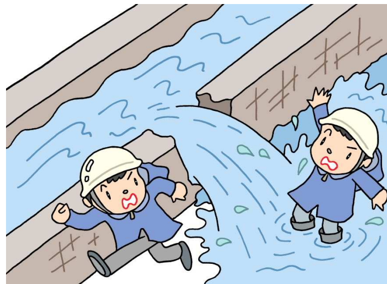
さいがい A4 ていほうけっかい