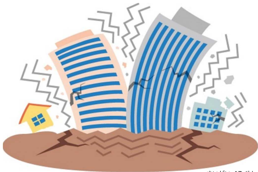
さいがい A7 じしん