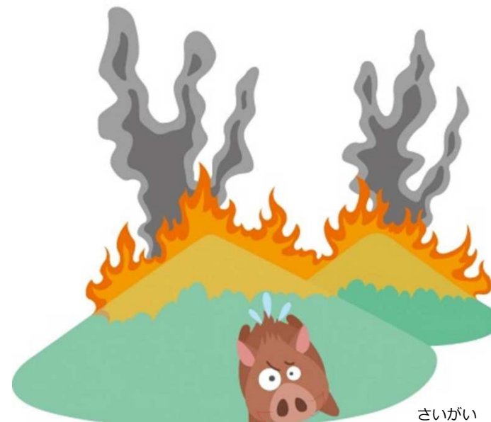
さいがい A12 やまかじ