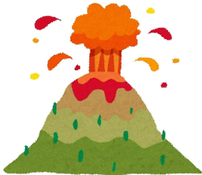
さいがい A11 ふんか