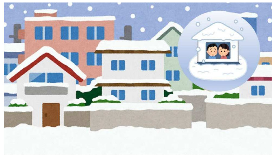
さいがい A10 おおゆき