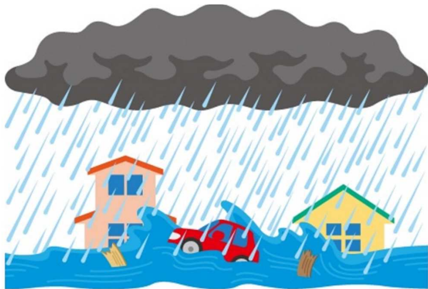
さいがい A1 おおあめ