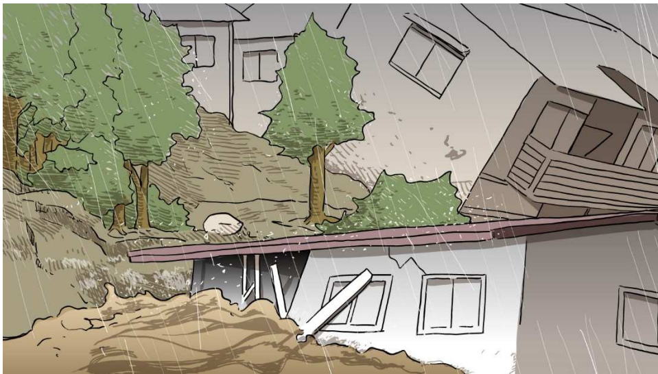
さいがい A5 どしゃくずれ