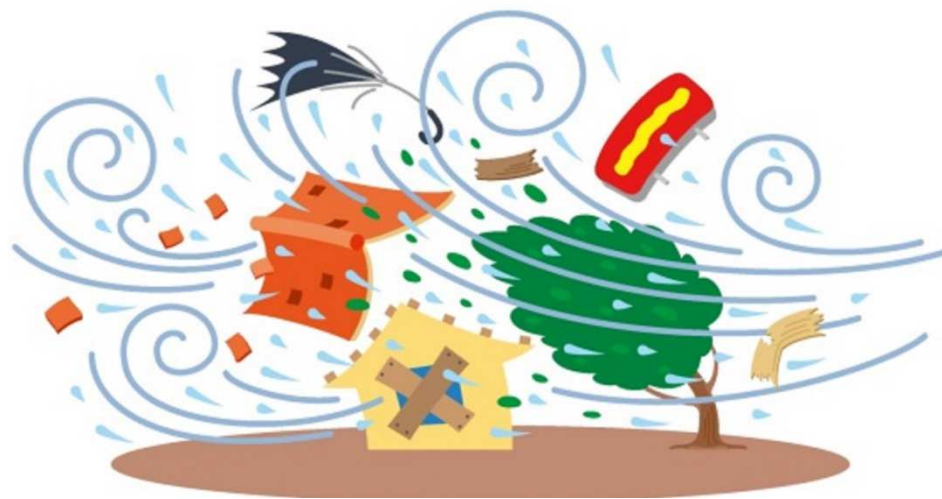
さいがい A3 ぼうふう