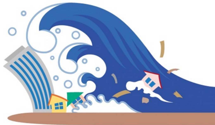
さいがい A8 つなみ