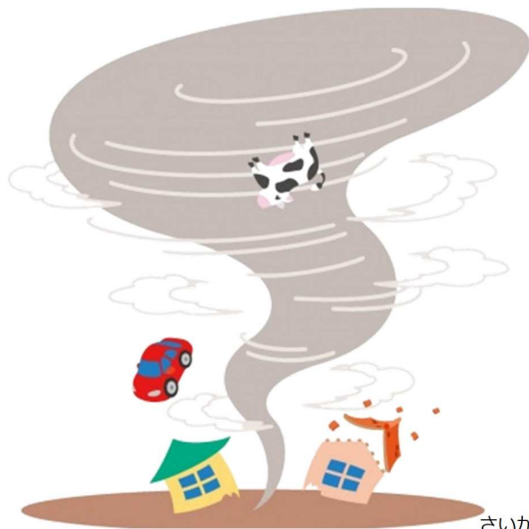
さいがい A9 たつまき