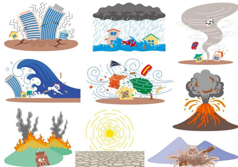
さいがい A14 しぜんさいがい