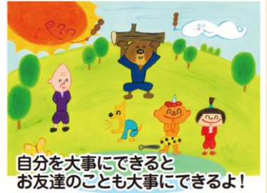
子ども向け紙芝居