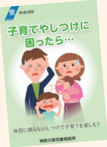
保護者向けリーフレット