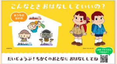
子ども向けカード