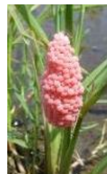
スクミリンゴガイの卵塊【写真4】