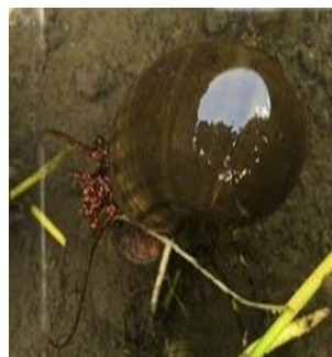
スクミリンゴガイ【写真3】

ピンク色の卵塊【写真4】を水田内、畦畔・水路周辺で確認したらすべて潰します。水田内への侵入・隣接水田への被害拡大を防ぐために、水口・水尻に6～9mm目合いの網を設置して捕殺します。